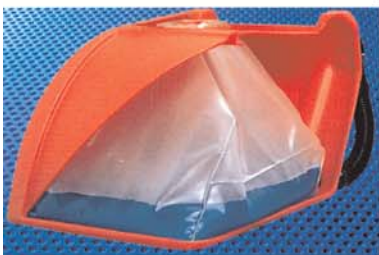
Maximales Fassungsvermögen mit Membrantank