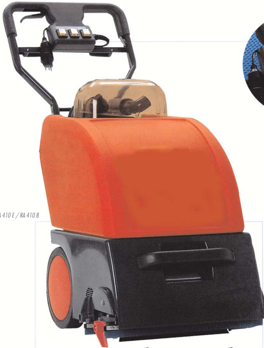
RA 410 E / RA 410 B

Übersichtliche Bedienelemente, wassergeschützt