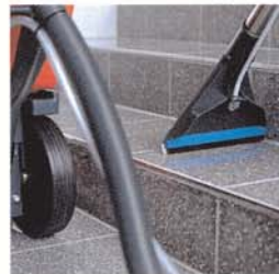
Adapteranschluss für die Reinigung an schmalen Stellen