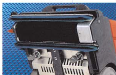
RA 400 E: Abhebbare Sauglippen