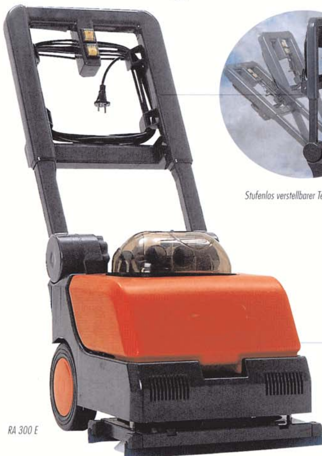
RA 300 E