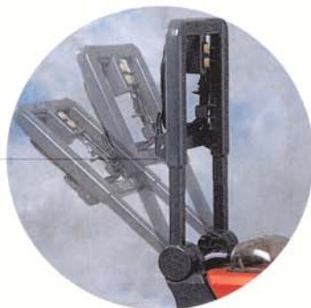
Stufenlos verstellbarer Teleskopbügel