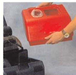
RA 300 E: Abnehmbarer Tank