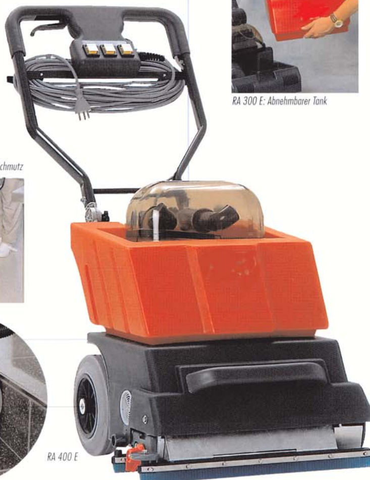
RA 400 E